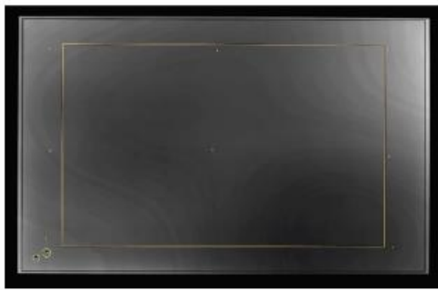
ムラと欠陥の識別

フィルタホイールシステムは、各三刺激画像を1つずつ順番に測定するのに対して、MCICの撮像素子は、三刺激(X, Y, Z)、スペクルおよびフリッカーのうち、最大4つを同時に測定することが可能です。MCICには可動部がないため、フィルタホイールが回転して各フィルタがセットされるのを待つ必要がなくなり、MCICはフィルタホイール色彩計よりも4倍速で計測ができます。マルチコアPCを使用して高速データ処理を行う場合は、Photometrica®とSDKによってスレッド関数がサポートされます。ホストPCから各三刺激システムへの平行高速USB 3.0接続により、より多くのデータ情報量を得られます。